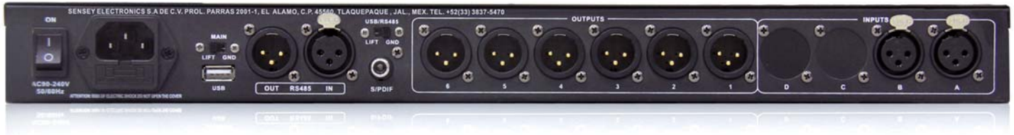
• vista posterior