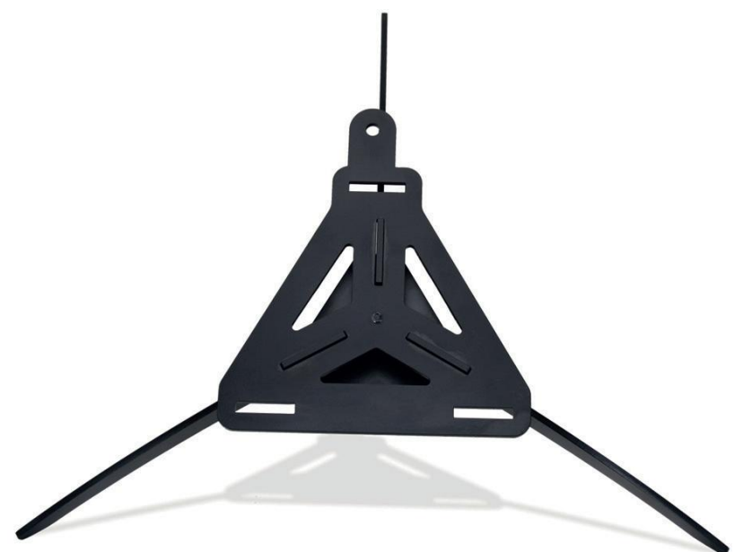
Base accesorio incluido

La base incluida en cada Bafle NO se diseñó para mas de dos bafles apilados. Evite situaciones de riesgo intentándolo.